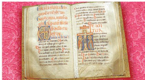
Messale manoscritto del XII secolo. Modena, archivio capitolare.